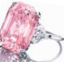
Кольцо с розовым графф. Цена – 34 500 000 евро