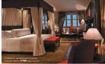
Стильность проживания на вилле Colonial Manor € 700 евро в сутки.

стижения, эксклюзивный дизайн и классика. Кроме отличных возможностей для спорта и пляжного отдыха, к услугам гостей Capella Singapore также спа-центр, бассейн, фитнес-зал, поле для гольфа, СПА-центр, прядоложащая процедура, разработанные на основе разных фаз луны. А еще можно отправиться в романтический круиз под парусом или на увлекательную экскурсию по Сингапуру на автомобиле Balli-Royce. Романтическое настроение создаст ресторан Casca и The Knolls, Balli Bar с террасой и видом на каскадные бассейны.